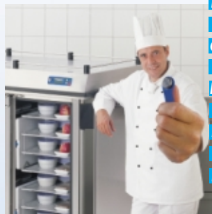
R E G E N E R E R