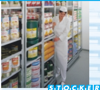
S T O C K E R