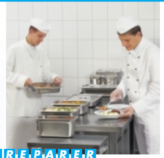
P R E P A R E R