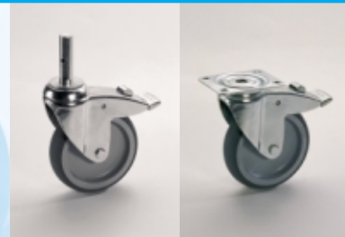
Choix de roulettes, version basique, roulettes en acier chromé zingué, avec un tenon ou une platine selon les versions.