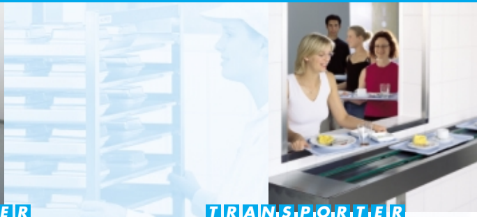
T R A N S P O R T E R