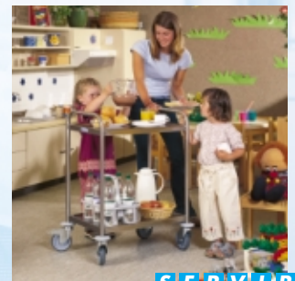
S E R V I R

La gamme de produits HUPFER® ne s'arrête pas aux chariots de service. Nous vous proposons toute une palette de produits vous permettant de maîtriser parfaitement votre logistique en restauration. Nous avons des solutions pour résoudre vos problèmes de transport, stockage, rangement, préparation, distribution, régénération et conservation.