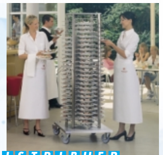
D I S T R I B U E R