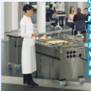
C O N S E R V E R