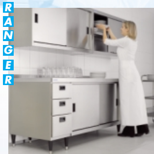
R A N G E R