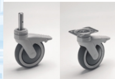
Roues en polyamide avec un tenon ou une platine selon les versions.